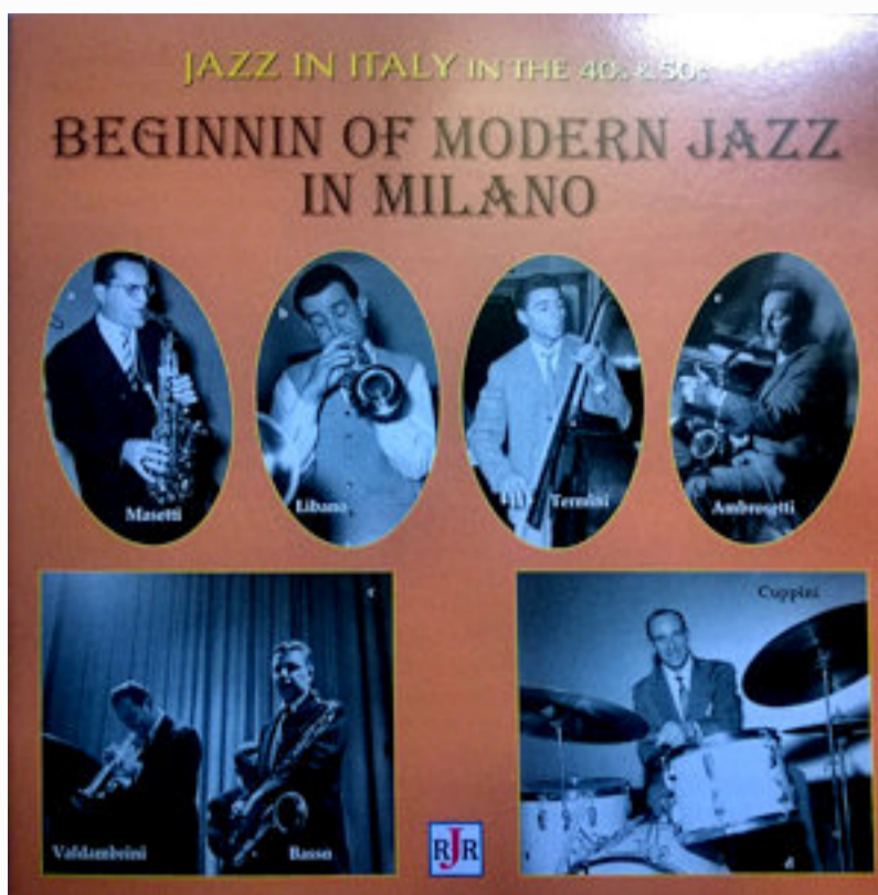
Riviera Jazz Records (2013)